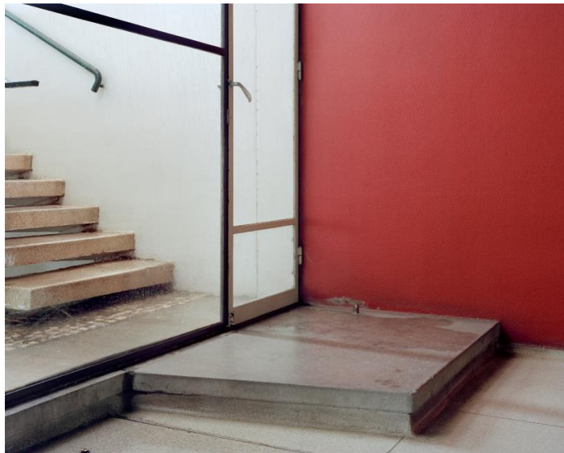
Águas Livres, 2014.

Enlace a imágenes: https://cutt.ly/NF9KQOv